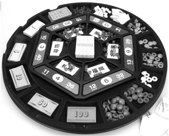
↑ MGゲーム盤 この盤を1卓6名で囲んで、ゲームを行います。