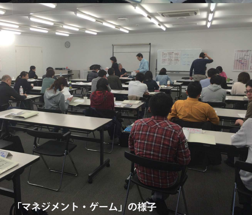
「マネジメント・ゲーム」の様子